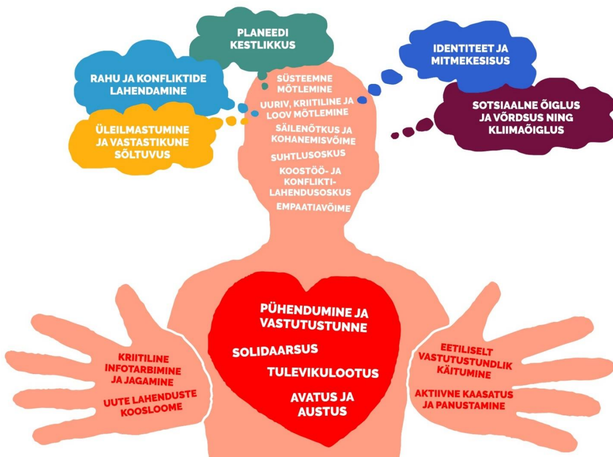
Pilt 2: Maailmakodaniku pädevusmudel (kujundanud Triinu Tulva)